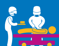
அவசரகால அறுவைச் சிகிச்சை