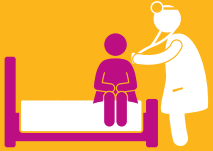
குழந்தை மருத்துவ உள்நோயாளி பிரிவு

புதிய சிறப்பு அவசரச் சிகிச்சை மருத்துவமனை எப்சம், செயிண்ட் ஹெலியர் அல்லது சட்டன் மருத்துவமனையில் அமையலாம். எந்த இடம் தேர்ந்தெடுக்கப்பட்டாலும், புதிய மருத்துவமனை கட்டப்படும் வரை ஆறு சேவைகளும் ஒன்றிணைக்கப்பட மாட்டாது. வேலை தொடங்கப்பட்டவுடன், பல்வேறு தெரிவுகளில் ஒவ்வொன்றையும் கட்டுவதற்கு நான்கு முதல் ஏழு வருடங்கள் ஆகிவிடும்.